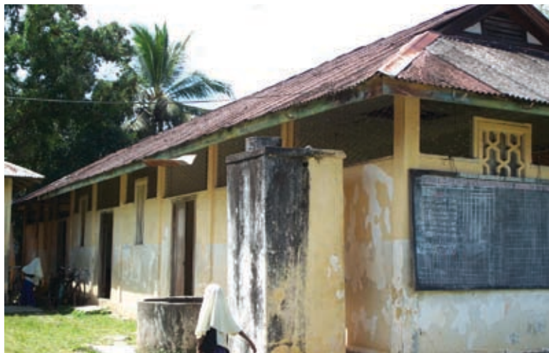
Enkle tavler på væggene viser timeplanen for eleverne på Ziwani

kert og koster megen tid. Lærerne er derfor oftest nødt til, at bruge deres egne midler til, at udskrive eksamensopgaver eller bruger alternativt kridt og tavler.