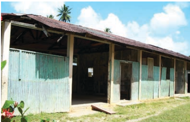
En af skolens bygninger som har desperat behov for reparationer

Situationen skyldes den simple kendsgerning, at bygningerne er for gamle og ikke er blevet vedligeholdt eller renoveret siden 1929. Dette tvinger derfor skolen til, at søge velgørende hjælp for i det mindste bare at kunne gennemføre de mest