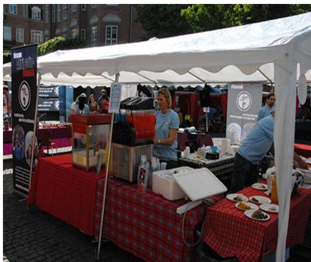
Frivillige på Market Fair 2009